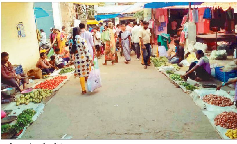
गुदरी बाजार में सब्जी खरीदते ग्राहक।

बरसात में टमाटर की अधिकांश फसल खराब हो गई है पूर्व में अधिक उत्पादन होने के कारण इस बार टमाटर की कीमतें नियंत्रित रही तथा टमाटर अधिकांश 20-30 रूपए किलो की दर से बिका पिछले एक पखवाड़े से टमाटर की कीमतें आसमान पर पहुंच गई हैं। चार दिन पूर्व तक टमाटर 80 रूपए किलो की दर से बिक रहा था। मौसम साफ होने के बाद टमाटर की कीमतों में कमी आई है तथा टमाटर 40 रूपए से 60 रूपए किलो की दर से बिक रहा है। बारिश होने के कारण टमाटर की स्थानीय फसल दानादार हो गई है। थोक मण्डों में स्थानीय टमाटर 20 रूपए से 40 रूपए वहाँ बैंगलोर का टमाटर 40-60 रूपए किलो बिक रहा है। इस बार पाट क्षेत्रों में बड़ी संख्या में कुपकों ने टमाटर की खेती की है। नई फसल आने पर टमाटर की कीमतें कम होने का अनुमान लगाया जा रहा है।