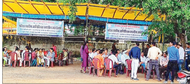
मांगों को लेकर हड़ताल पर बैठे पटवारी।

वर्तमान में भी भुड़यां साफ्टवेयर में कई तरह की तकनीकी खामियों को जल्द दूर करने की मांग पर पटवारी फिर एक बार अनिश्चितकालीन हड़ताल शुरू कर कर दिया, जिसकी वजह से तहसील कार्यालयों में काम अटक गया है। मिनी स्टेडियम में प्रवेश व्यापी हड़ताल पर बैठे राजस्व पटवारियों ने बताया कि ऑनलाईन नक्शा बंटान, संशोधन पहले पटवारी आईडी में संशोधित कर राजस्व निरीक्षक को आईडी में भेजा जाता है। जिसके कारण जब तक राजस्व निरीक्षक