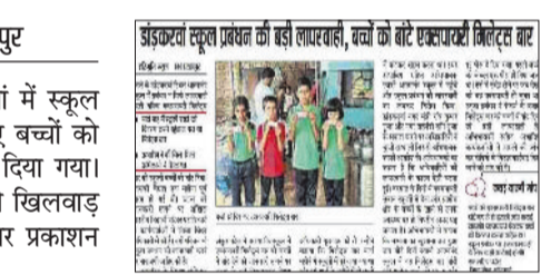
उपखण्ड सूत्र प्रबंधन की बड़ी लापरवाही, बच्चों को बर्दाश्त करके एक्सपायरी मिलेट्स बार